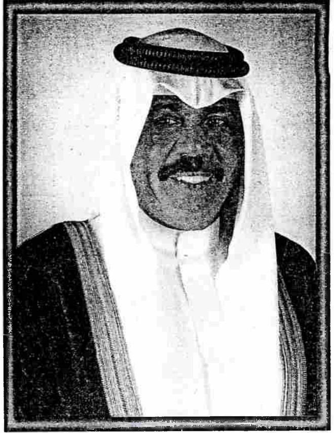
سَيِّدُ الشَّيْخِ نَوَافُ بْنُ أَحْمَدَ بْنِ أَبِي الصَّبَّاحِ وَلِيَّ عَهْدِ دَوْلَةِ الْكُوَيْتِ